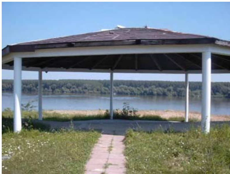
Lidija Vrhovac, I-10

Naša poseta Institutu nije bila dovoljna da obiđemo sve laboratorije. Amfiteatar na obali Dunava će biti mesto sledećeg okupljanja.