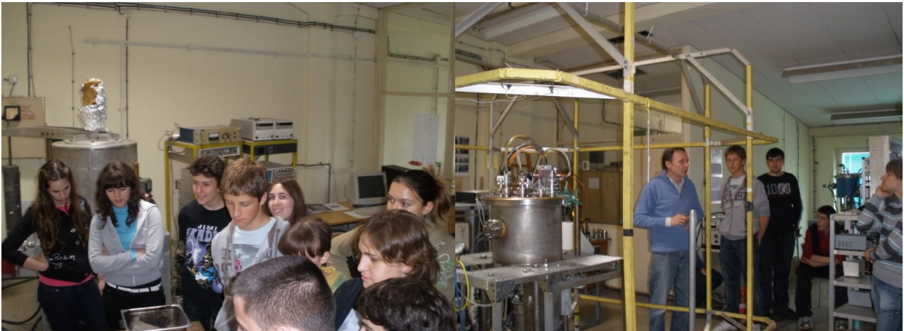
Učenici odeljenja I-10 u poseti Centru za atomsku i subatomsku fiziku

Naša poseta Institutu nije bila dovoljna da obiđemo sve laboratorije. Amfiteatar na obali Dunava će biti mesto sledećeg okupljanja.