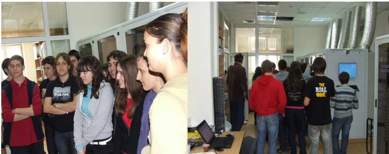
Učenici odeljenja I-10 u poseti Laboratoriji za primenu računara u nauci.