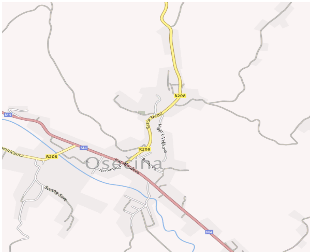
Улица браће Недић у Осечини

Осечина се овим јунацима одужила и улицом Браће Недић, у којој се налази народна билиботека Осечина, црква Осечина, гробље Осечина, Основна школа „Браће Недић“, пошта Осечина и фабрика намештаја „Тапос“.