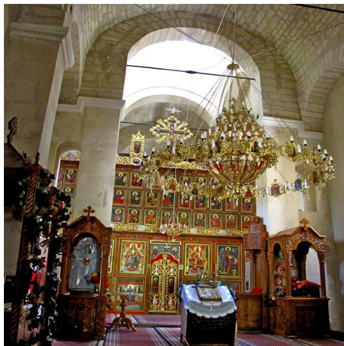
Унутрашњост манастира Чокешина