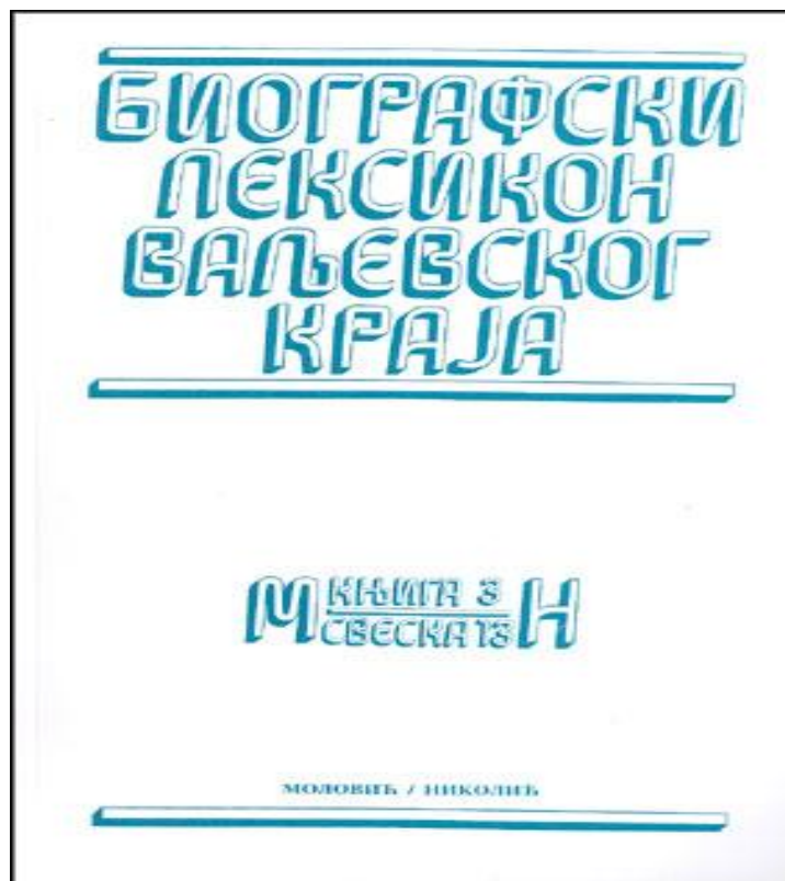
Биографски лексикон Ваљевског краја

Издавачко друштво „Колубара“ је у лето 1996. године почело са објављивањем „Биографског лексикона Ваљевског краја“. Лексикон излази у свескама с тим што пет редовних и једна допунска свеска чине једну књигу. У 13 досадашњих свезака, на 1040 страна, објављено је више од 1500 биографија. Највише простора испуњено је биографијама устаничких вођа из прве две деценије 19. века, између осталих, браће Недић из Осечине.