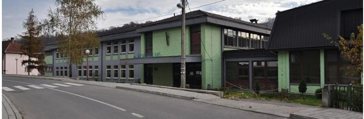
Основна школа „Браћа Недић“ у Осечини

Поред Осечине, улицу са називом ових хероја има и Београд, Ваљево као и Шабац.