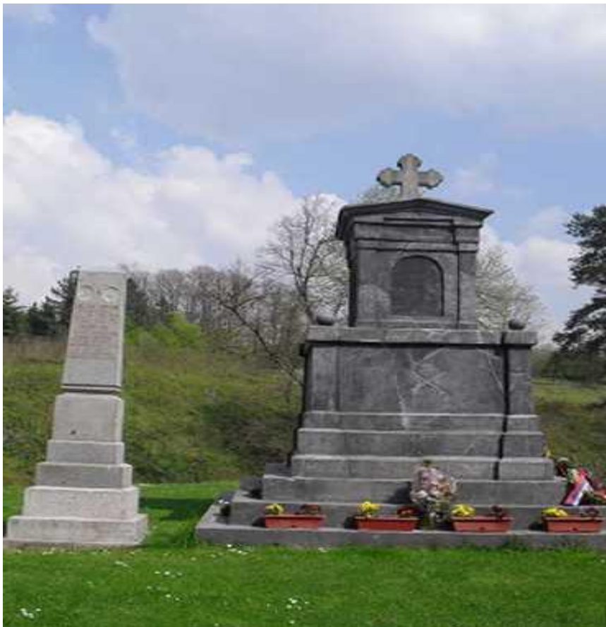
Споменик Браћи Недић и ратницима у боју на Чокешини

Сваке Лазареве суботе, у цркви манастира Чокешина, после литургије, читају им се на парастосу имена.