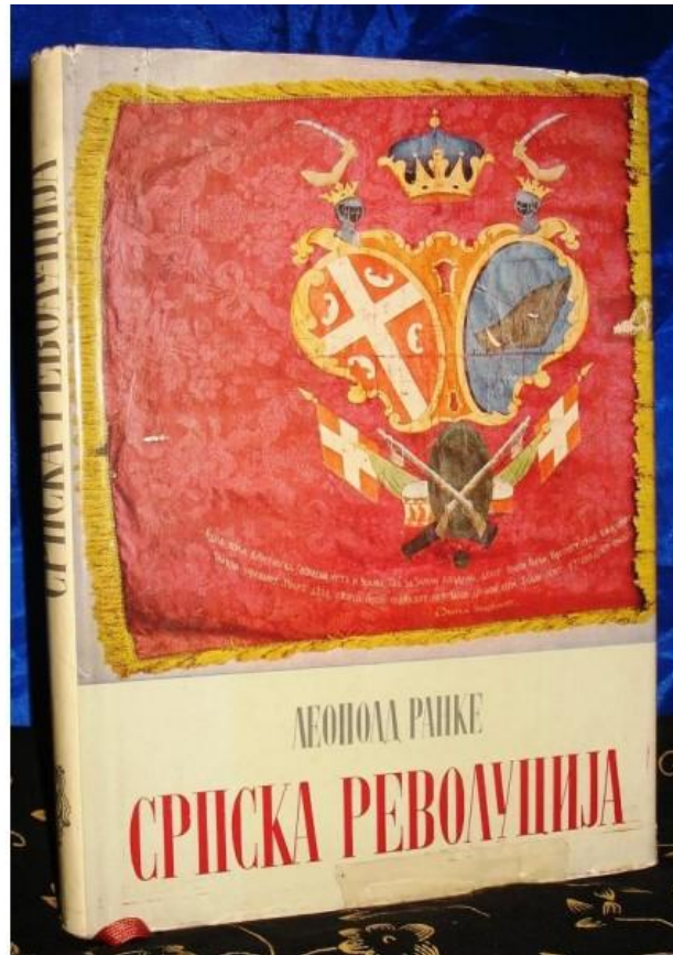
„Српска револуција“ - Леополд Ранке

Познати немачки историчар Леополд Ранке, у својој књизи „Српска револуција“ посветио је неколико страница бици у Чокешини, коју је назвао „српским Термопилима“, а браћу Недић „српским Леонидама“. 8