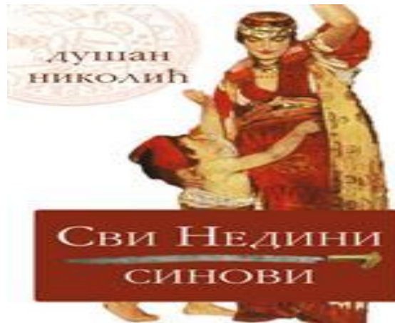
Сви Недини синови

Издавачко друштво „Колубара“ је у лето 1996. године почело са објављивањем „Биографског лексикона Ваљевског краја“. Лексикон излази у свескама с тим што пет редовних и једна допунска свеска чине једну књигу. У 13 досадашњих свезака, на 1040 страна, објављено је више од 1500 биографија. Највише простора испуњено је биографијама устаничких вођа из прве две деценије 19. века, између осталих, браће Недић из Осечине.