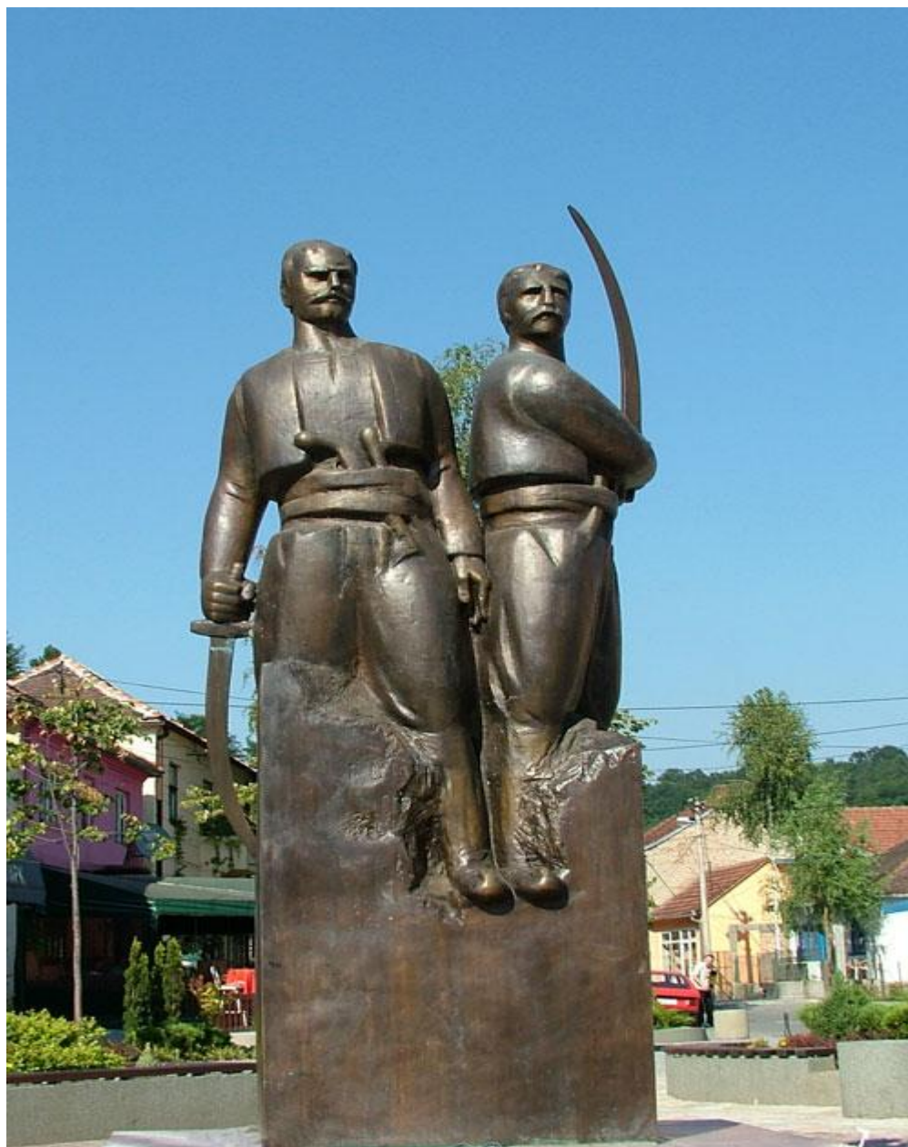
Споменик браћи Недић у Осечини

Такође , стара црква у Осечини позната је и по томе што је годинама била чувар херојског симбола овог краја – заставе браће Недић. Центар Осечине је 2008. године претворен у градски трг којим доминира управо споменик браћи Недић.